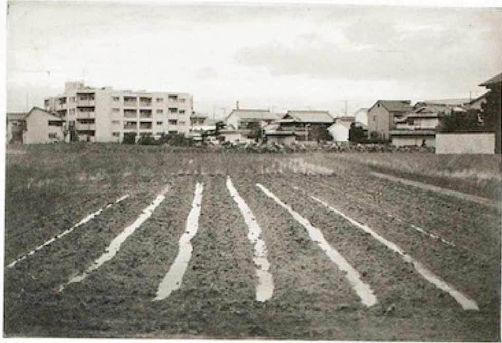
Je suis né dans le lit d'un fleuve noble