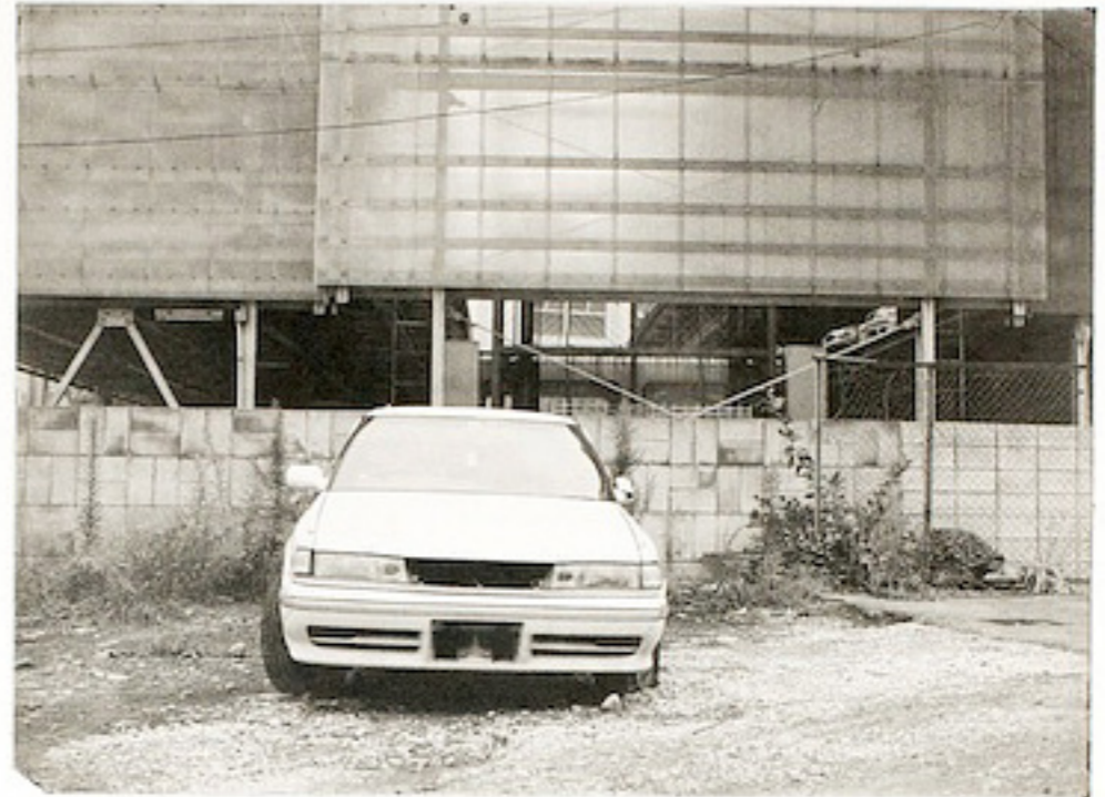
Je coule désormais mu de ma propre force