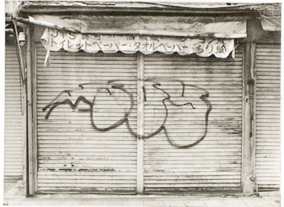
Ses lacets forment un dessin identifiable parmi 1000 autres