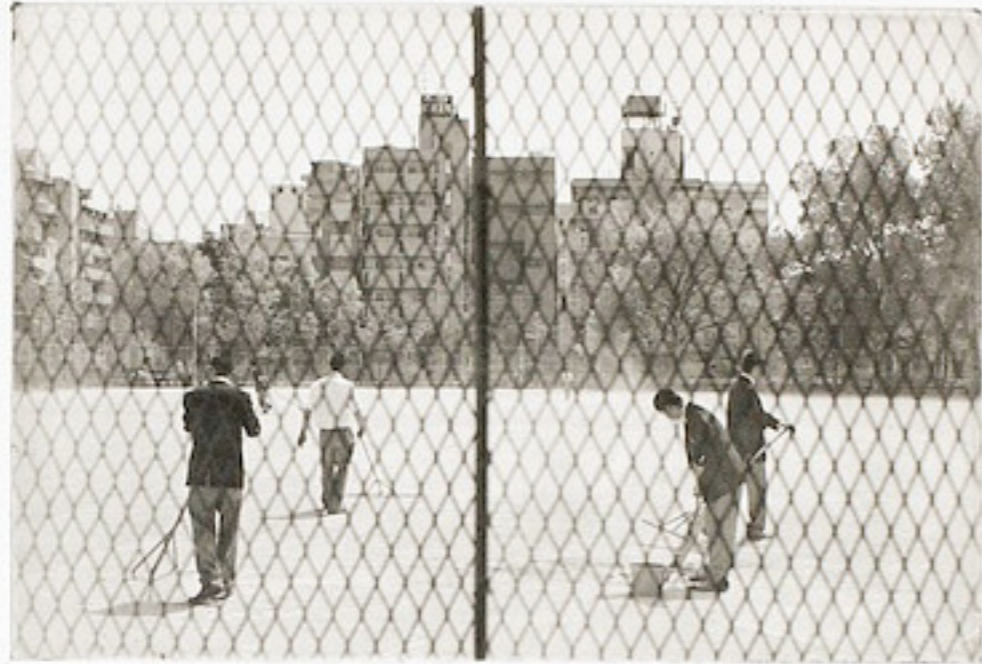
Dans sa partie amont, le fleuve est un torrent